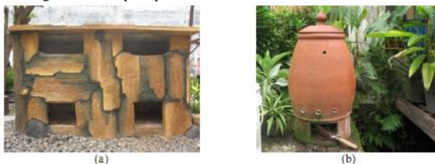
Gambar 1. Bentuk-bentuk Komposter yang cocok untuk Halaman Rumah (Iswanto, 2009)

Sampah yang telah terpilah menjadi sampah basah dan kering selanjutnya dilakukan pengelolaan yaitu pengomposan dan pengumpulan sampah layak jual. Pengomposan merupakan teknik untuk mengolah sampah organik. Ada beberapa teknik mengolah sampah organik antara lain pengomposan, pembuatan briket dan biogas. Namun, teknik yang paling mudah dilakukan pada skala rumah tangga adalah mengubah sampah organik menjadi kompos. Pengomposan adalah proses penguraian terkendali bahan-bahan organik menjadi kompos yaitu bahan yang tidak merugikan lingkungan. Pada dasarnya sampah organik dapat terurai secara alami di alam, tetapi pada kondisi yang tidak dikontrol ini menyebabkan proses peruraian ini akan menimbulkan dampak lingkungan seperti lingkungan menjadi kotor, muncul bau tidak sedap, rembesan air lindi yang tidak terkendali dan lain sebagainya. Pengomposan sampah organik dalam rumah tangga yaitu sampah sisa makanan, sisa potongan sayur dan buah serta sampah sapuan halaman dilakukan dalam alat yang disebut komposter. Kebutuhan komposter disesuaikan dengan jumlah sampah organik yang dihasilkan dalam suatu rumah tangga. Rumah yang mempunyai halaman luas dengan berbagai tanaman dapat menyediakan komposter dengan bentuk seperti pada Gambar 1.