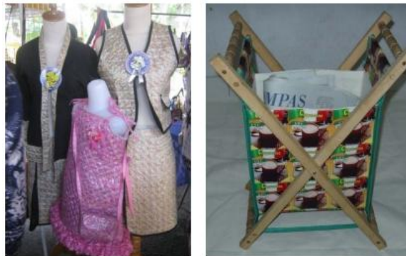
Gambar 3. Produk Daur Ulang Sampah Plastik Kemasan Berlapis Aluminium Foil

Sampah rumah tangga yang terbesar volume sampahnya adalah plastik. Hal ini dikarenakan berkembangnya industri dan perubahan gaya hidup masyarakat mengarah pada konsumerisme menyebabkan plastik telah menjadi bagian dari gaya hidup masyarakat saat ini (Putra, 2010). Pada rumah tangga, sampah plastik yang sering dihasilkan adalah tas kresek, wadah atau botol kemasan produk seperti shampo, air mineral dan lain-lain serta plastik kemasan berlapis aluminium foil. Dari ketiga jenis plastik ini yang tidak memiliki nilai jual bagi pihak ketiga adalah plastik kemasan berlapis aluminium foil. Hal ini dikarenakan plastik ini tidak dapat dilebur karena adanya lapisan aluminium foil. Oleh karena itu, pengelolaan yang dapat dilakukan dilakukan pada sampah ini adalah dengan mendaur ulang menjadi kerajinan atau produk berguna. Gambar 3 memperlihatkan contoh dari produk hasil daur ulang sampah plastik kemasan berlapis aluminium foil.