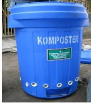
Gambar 2. Bentuk Komposter dari Bahan Plastik

Kompos yang dihasilkan dari pengomposan sampah organik dapat digunakan untuk memupuk tanaman yang dimiliki oleh rumah tangga sehingga selain sampah organik terolah tanaman juga tumbuh subur. Selain untuk menyuburkan tanaman, kompos ini juga dapat digunakan untuk menyuburkan tanah yang sudah kehilangan unsur hara akibat penggunaan pupuk anorganik. Menurut Murbandono (2008), salah satu unsur pembentuk kesuburan tanah adalah bahan organik (salah satunya kompos). Selain itu, pemanfaatan pupuk organik (kompos) untuk tanah sangat membantu memperbaiki struktur tanah, meningkatkan permeabilitas tanah, dan mengurangi ketergantungan bahan pada pupuk anorganik (Hadisuwito, 2008). Oleh karena itu, jika kompos yang dihasilkan dalam rumah tangga melebihi kebutuhan, maka kompos ini dapat dijual atau dibagikan kepada tetangga atau kolega yang membutuhkan manfaat dari kompos tersebut.