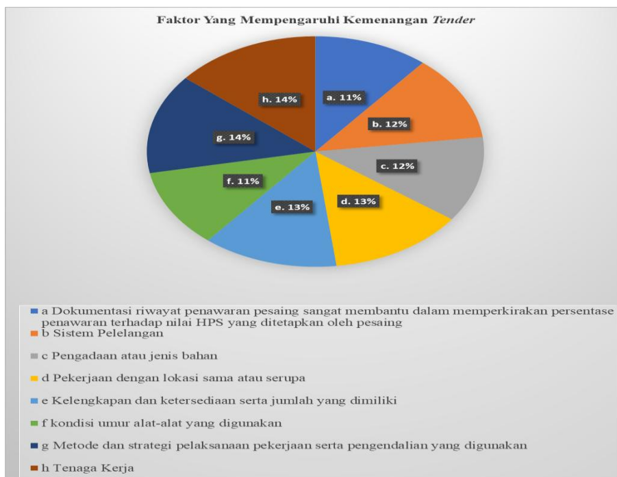
Gambar 2. Persentase Faktor Lain Yang Mempengaruhi Kemenangan Tender

2. Adapun hasil rata – rata dari kuisisioner faktor lain yang mempengaruhi kemenangan tender yaitu: