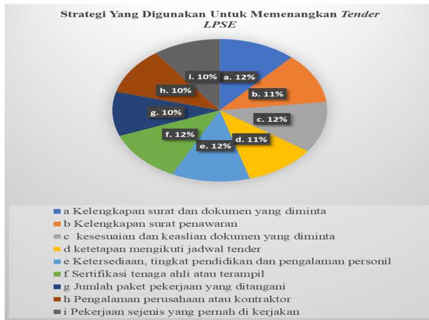
Gambar 1 Persentase Strategi Penawaran Memenangkan Tender Online

1. Adapun strategi yang digunakan untuk memenangkan tender LPSE adalah sebagai berikut: